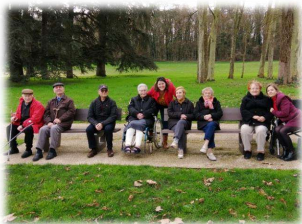
Sortie à la prairie de Soulièvres.

L'école des Corderies est venue passer un après-midi, nous avons discuté ensemble, ils nous ont emporté des cartes, nous avons fait des jeux de ballon puis pris le goûter. Nous ne savons pas qui des aînés ou des enfants se sont amusés le plus.